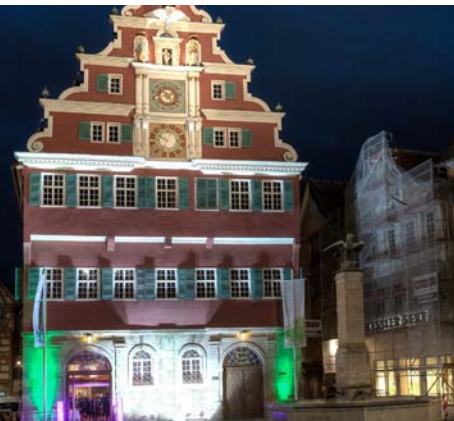
Das Alte Rathaus in Esslingen, Ort der Verleihung des Dr. Holger Müller Preises 2012